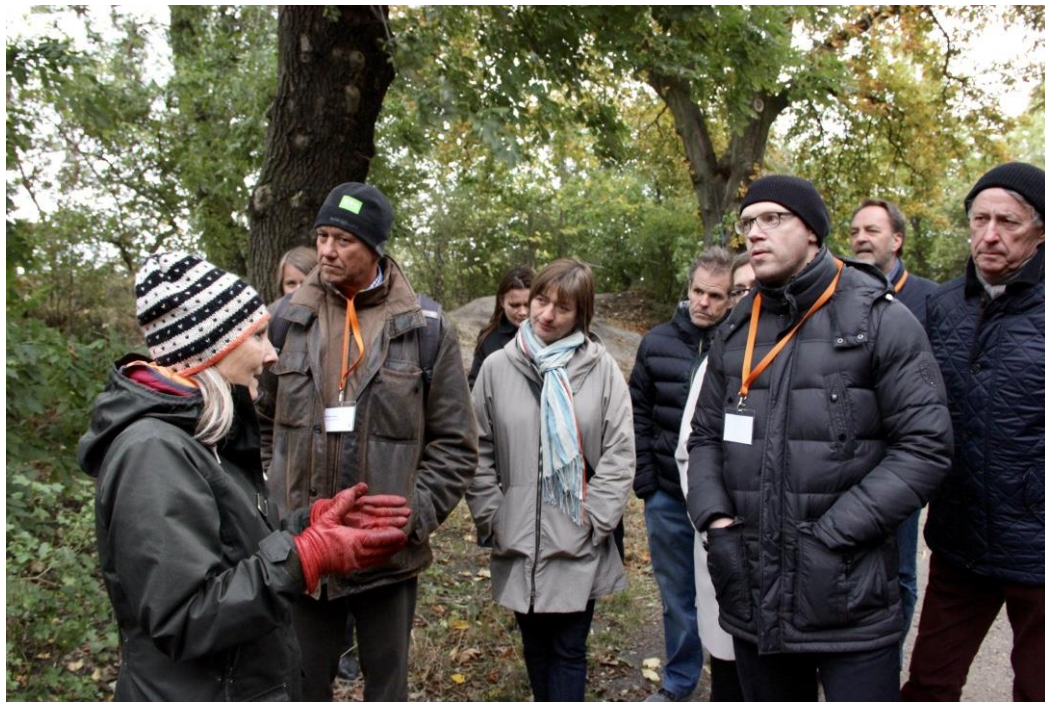
Vi gikk på arkitektur-tur i Christianias mangfoldige og multifarvede boliger.